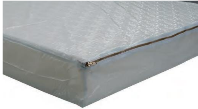
4119/20/25/26 - Housse imperméable Sandra