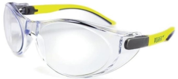
7902 - Lunettes de protection