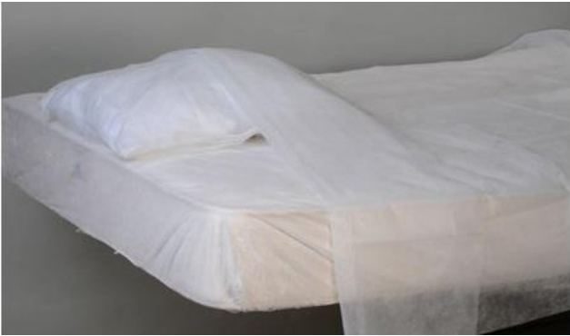
8110/20/205J - Literie jetable