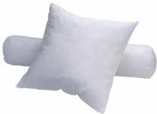
1120 - Oreiller lavable