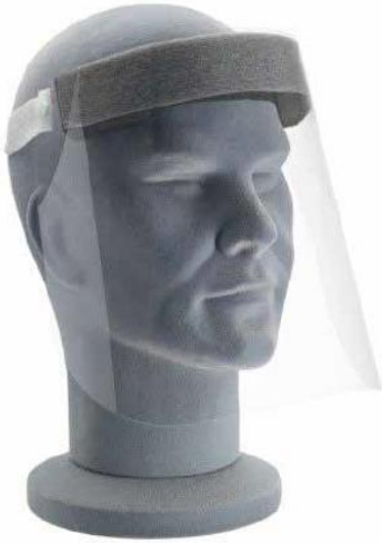
7901 - Visière intégrale visage