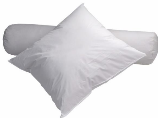
1200 - Oreiller imperméable